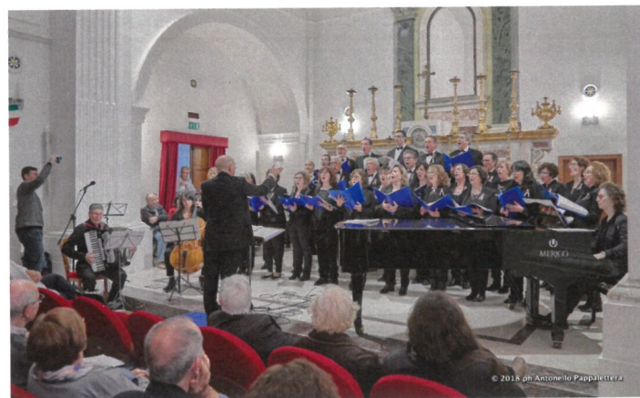
04 novembre 2018, Trani, Auditorium S. Luigi. Coro Polifonico "Il Gabbiano" nel I Canto della Grande Guerra

L'anno prossimo sarà il 40° anno di attività del coro e per celebrarlo al meglio sono in programma dei progetti ambiziosi che, grazie alla magistrale direzione del nostro Maestro e fondatore